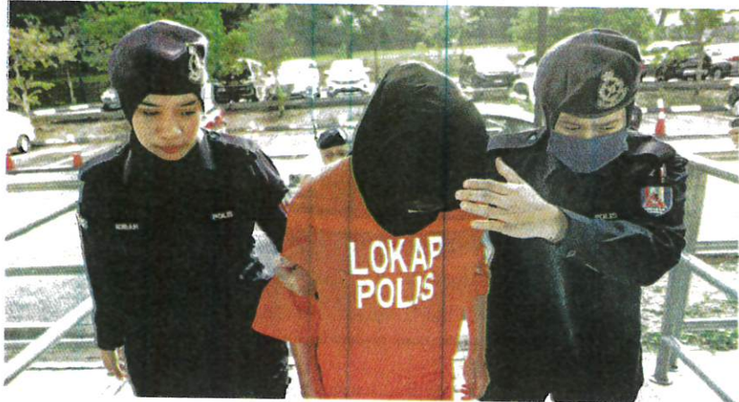
SEORANG remaja perempuan yang disyaki menceroob dan menyamar sebagai petugas hospital ketika dibawa ke Mahkamah Sepang pada 9 Ogos lalu.