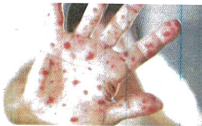
TIADA kematian direkodkan dalam sembilan kes jangkitan yang disahkan di Malaysia. - GAMBAR HIASAN

Mengulas lanjut, KKM berkata, ketika ini, terdapat sebanyak 99,176 kes Mpx di seluruh dunia dengan melibatkan 116 buah ne-