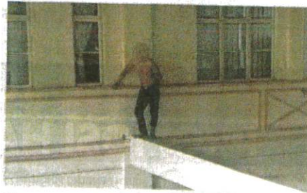
LELAKI cuba terjun dari tingkat satu HDOK, Sandakan.

AKHBAR : HARIAN METRO MUKA SURAT : 10 RUANGAN : LOKAL